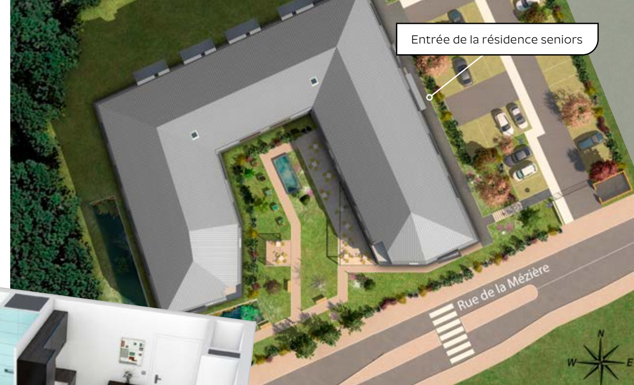
Entrée de la résidence seniors