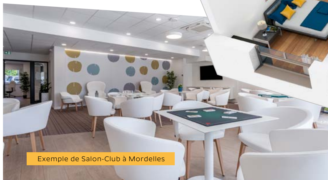
Exemple de Salon-Club à Mordelles