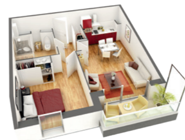
Exemple de disposition pour un appartement 2 pièces