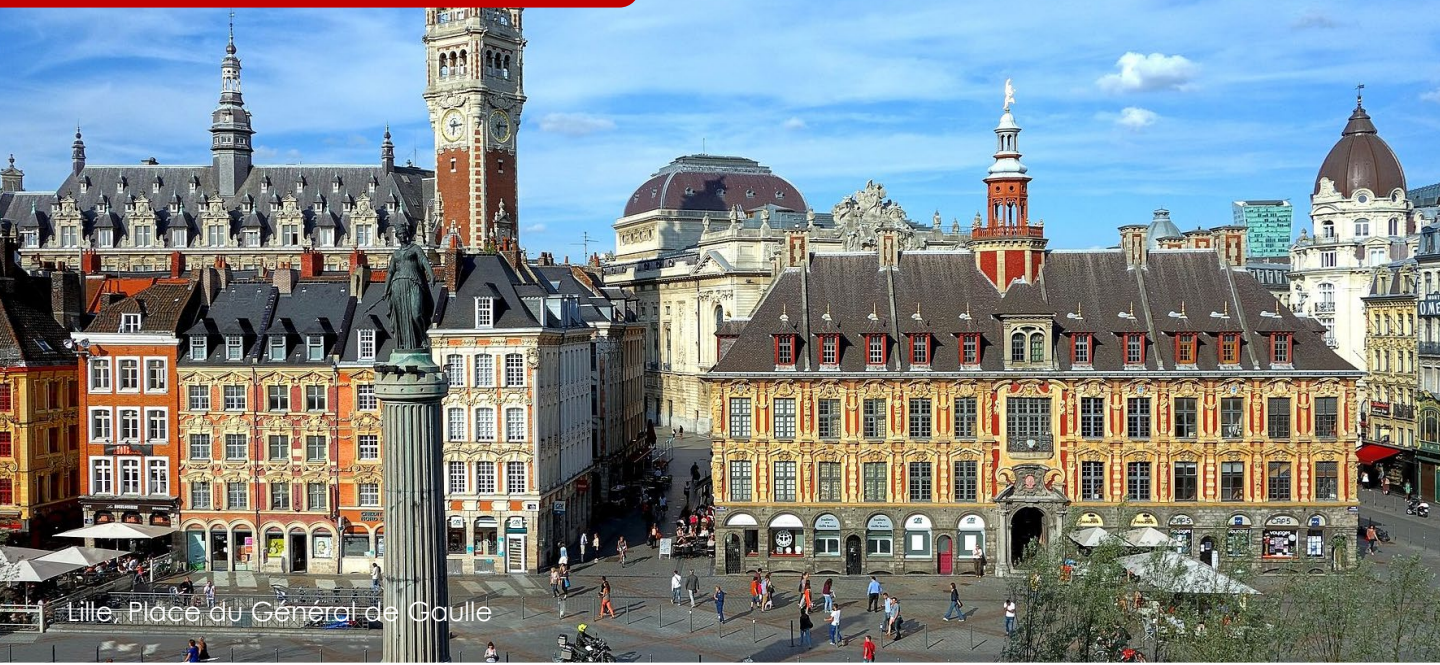
Lille, Place du Général de Gaulle