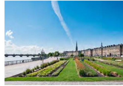
Quais de Bordeaux