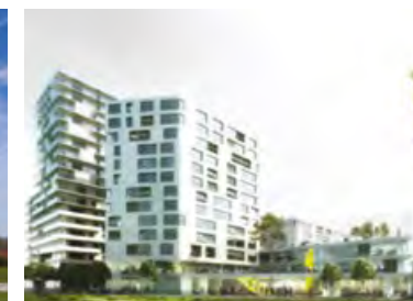
Résidence Baud-Chardonnet - Rennes