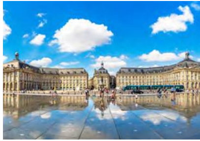
Place de la Bourse