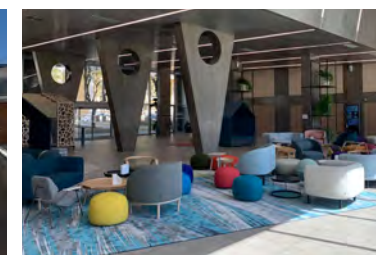
Campus Créatif - Montpellier - (Espace extérieur et espace de détente)