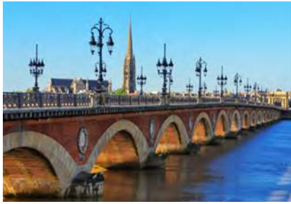
Pont de Pierre