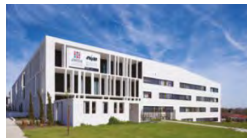
Résidence Auzeville-Tolosane - Toulouse