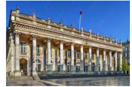
Le Grand Théâtre