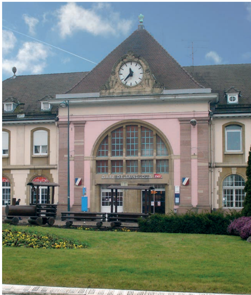
Gare de Saint-Louis