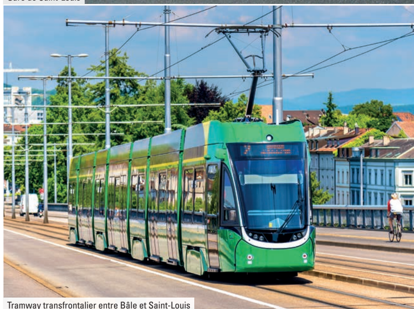
Tramway transfrontalier entre Bâle et Saint-Louis