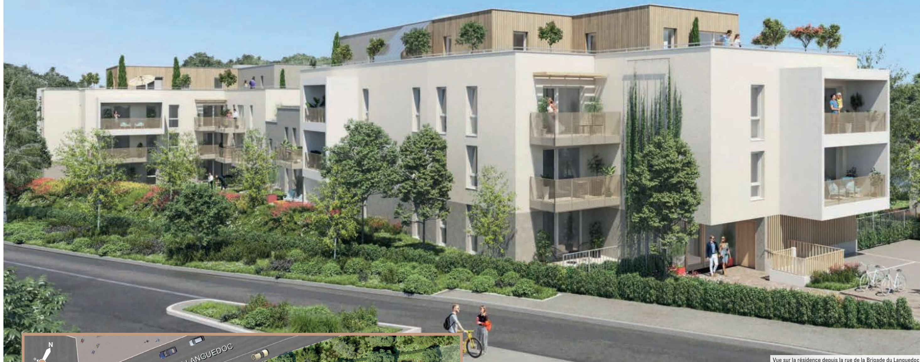
Vue sur la résidence depuis la rue de la Brigade du Languedoc

Une résidence contemporaine et intimiste, préservée par un cadre verdoyant.