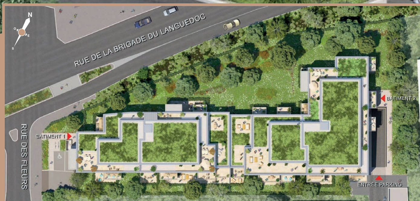
Vue du ciel

Entre ville et nature, retrouvez “Cour Saint-Louis”, une nouvelle réalisation à taille humaine entourée d’un très bel écrin arboré et paysager. Avec seulement 3 étages, elle séduit par son élégante sobriété lui permettant de se fondre tout naturellement dans son cadre résidentiel.