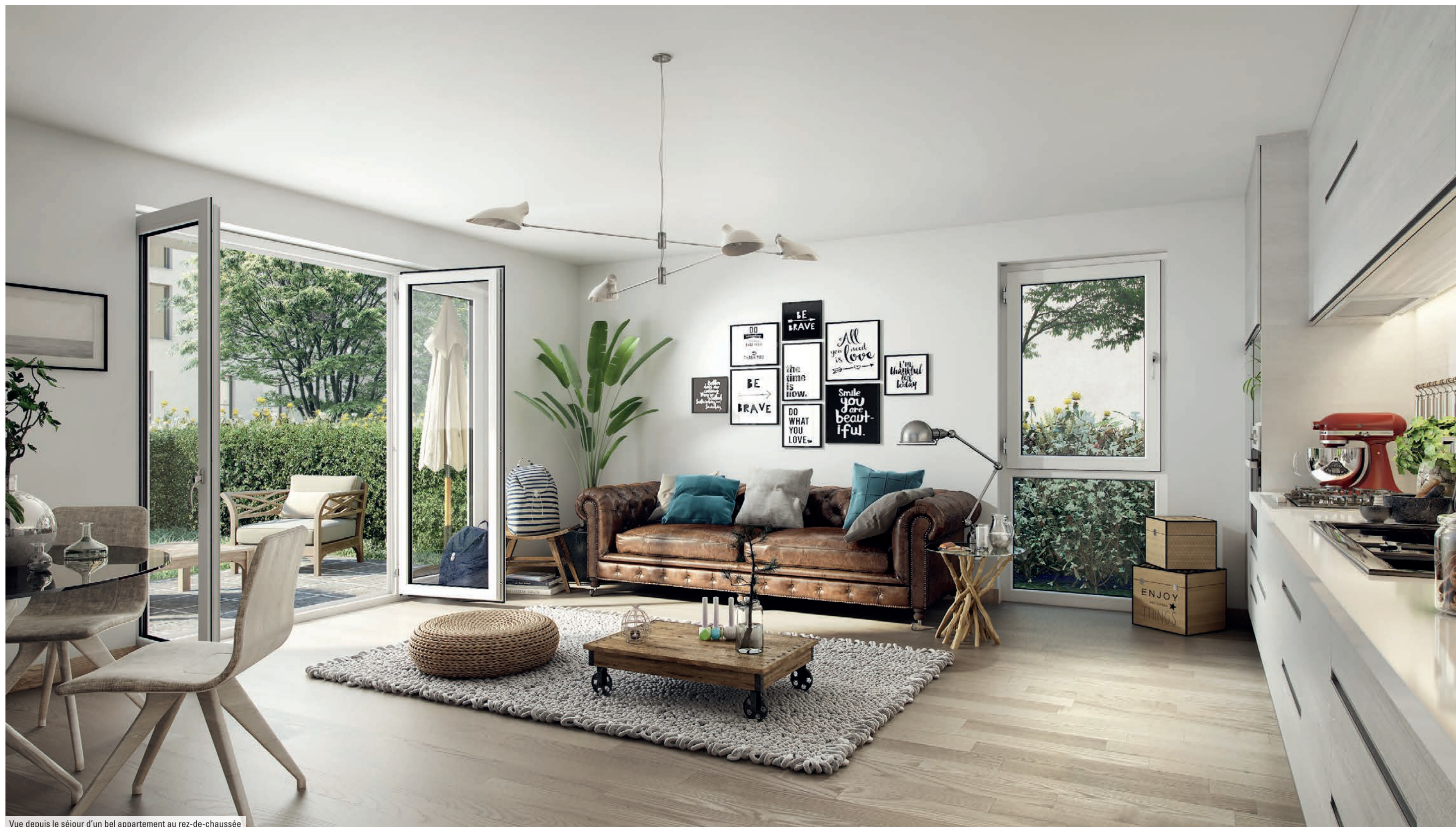
Vue depuis le séjour d'un bel appartement au rez-de-chaussée

Ici, chaque appartement inspire le confort et le bien-être.