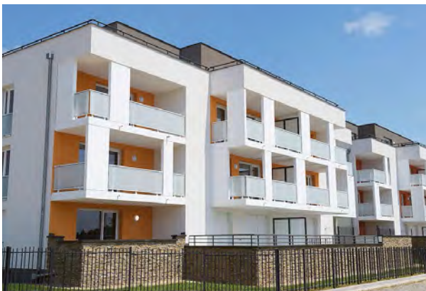
LOGEMENTS : RÉSIDENCE DU GRAND CHÊNE - BRUMATH

La maîtrise de l'ensemble de nos métiers et notre capacité d'innovation permanente nous permettent de répondre à vos attentes, en vous apportant des solutions sur-mesure qui anticipent les futures mutations des modes de vie.