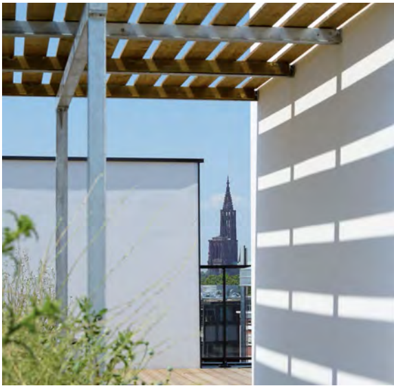
LOGEMENTS : AXIOM / STRASBOURG