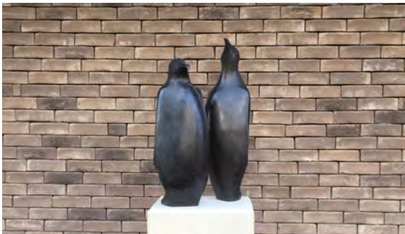
SCULPTURE LES EMPEREURS / © PATRICK LANG

Pour vous, la garantie de pouvoir compter sur une réelle proximité.