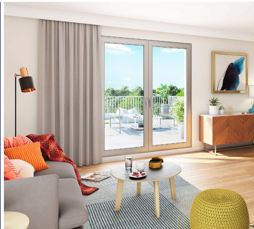
Illustration et mobilier non contractuels