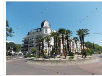
Dôme du Plessis Le Plessis Robinson (92) 11 340 m 2 Co-promotion