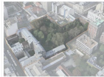
110 rue de Vaugirard Paris 6ème (75) 8670 m 2 Maîtrise d'Ouvrage Déléguée Diocèse de Paris