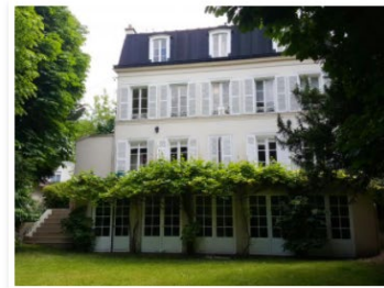
Kellner Bougival (78) Maison de 275 m 2 / Terrain arrière de 1 245 m 2 Promoteur