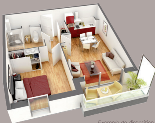
Exemple de disposition pour un appartement 2 pièces