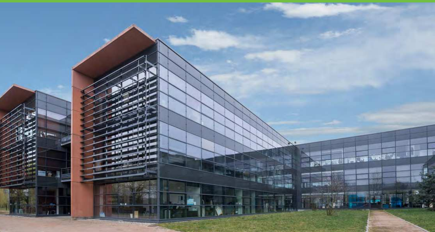
Saint-Priest, Mylan Ilena