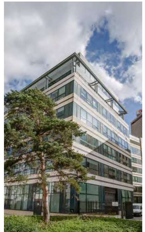
Saint-Denis, le Pleyel

Consultez votre conseiller qui vous apportera les solutions adaptées à vos objectifs et à votre situation.