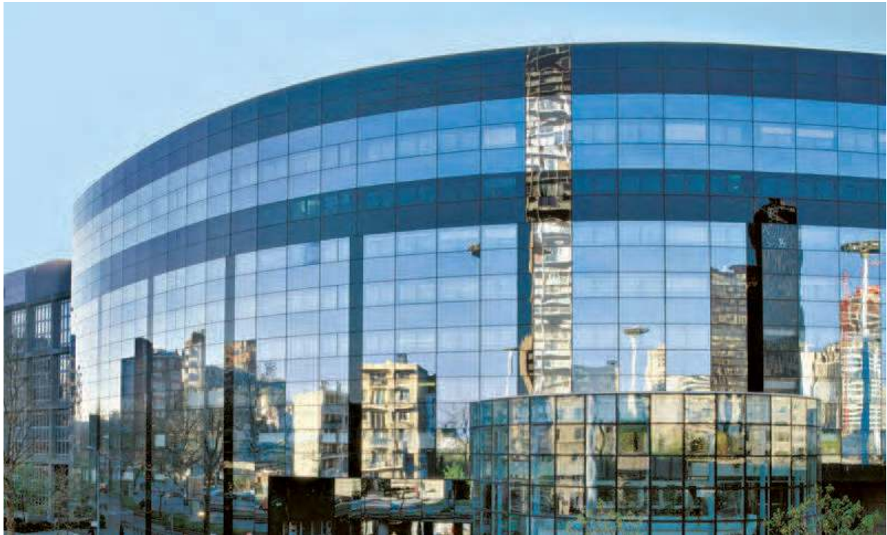
La Défense, le Wilson